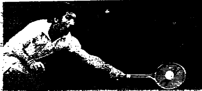
لقطة كلاب موفيل اورانيس (اسبانيا) أثناء مباراته مع شيرود سيبورت (الولايات المتحدة) - وقد فاز اورانيس (٦-٤، ٦-٢)